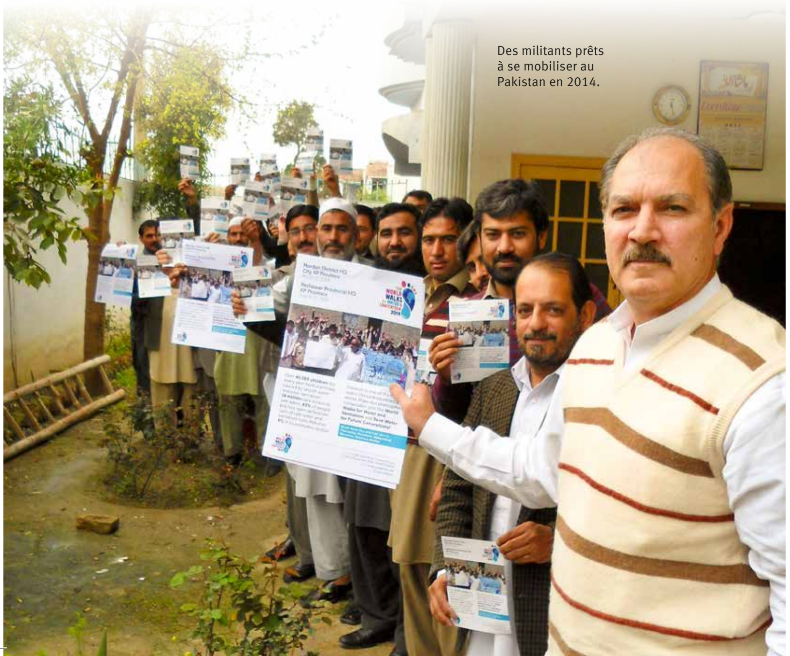
Des militants prêts à se mobiliser au Pakistan en 2014.