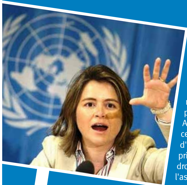
Catarina de Albuquerque, Rapporteur spécial de l'ONU sur le droit humain à l'eau potable et à l'assainissement.

Les gens se demandent souvent : « Qu'est-ce que les droits humains à l'eau et à l'assainissement signifient pour moi ? Ai-je droit à une certaine quantité d'eau à un certain prix ? » Mais le droit à l'eau et à l'assainissement est plus complexe que cela. Bien que des définitions générales mentionnant l'accès, la qualité