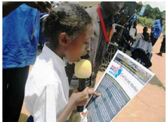
Lecture du manifeste de la société civile devant les médias et autres parties en Ouganda en 2011.

En Équateur, une coalition d'organisations indigènes et de la société civile a marché depuis les provinces jusqu'à la capitale pour protester contre une nouvelle loi relative à l'eau adoptée en juin 2014. Ils ont également créé une Assemblée populaire pour remettre en cause un certain nombre de politiques relatives à l'eau. Les militants disent que la loi va faciliter l'accès prioritaire aux sources d'eau des grandes industries telles que les sociétés minières ou les entreprises agroalimentaires au détriment des petits fermiers. Ils pensent aussi qu'elle permettra la privatisation complète de l'eau en Équateur.