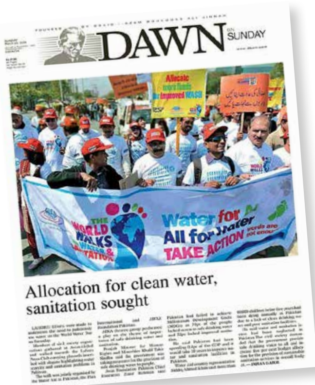
Une campagne World Walks for Water and Sanitation fait la une au Pakistan en 2014.

Les médias, qu'il s'agisse de médias télévisés, radio, papier ou en ligne, peuvent favoriser votre campagne en gagnant l'appui du public et en le sensibilisant, ce qui peut influencer un décideur. Cela peut être réalisé via un reportage pour les actualités ou en proposant l'analyse d'un problème. Vous pouvez envoyer des communiqués de presse aux journalistes (accompagnés d'un coup de téléphone), organiser une conférence de presse, écrire un blog ou publier votre propre tribune. Soyez audacieux et affirmez directement l'importance du problème ; dites qu'un droit humain a été violé si vous pensez que tel est le cas, et si vous pouvez gagner le soutien d'un institut des droits de l'homme ou du Rapporteur spécial de l'ONU, il est pratiquement certain que votre histoire sera publiée. Composer une photo, par exemple, un groupe de personnes effectuant une action symbolique ou réalisant un « coup de publicité », aidera également à attirer l'attention et à placer les personnes concernées par le problème au cœur de l'histoire.