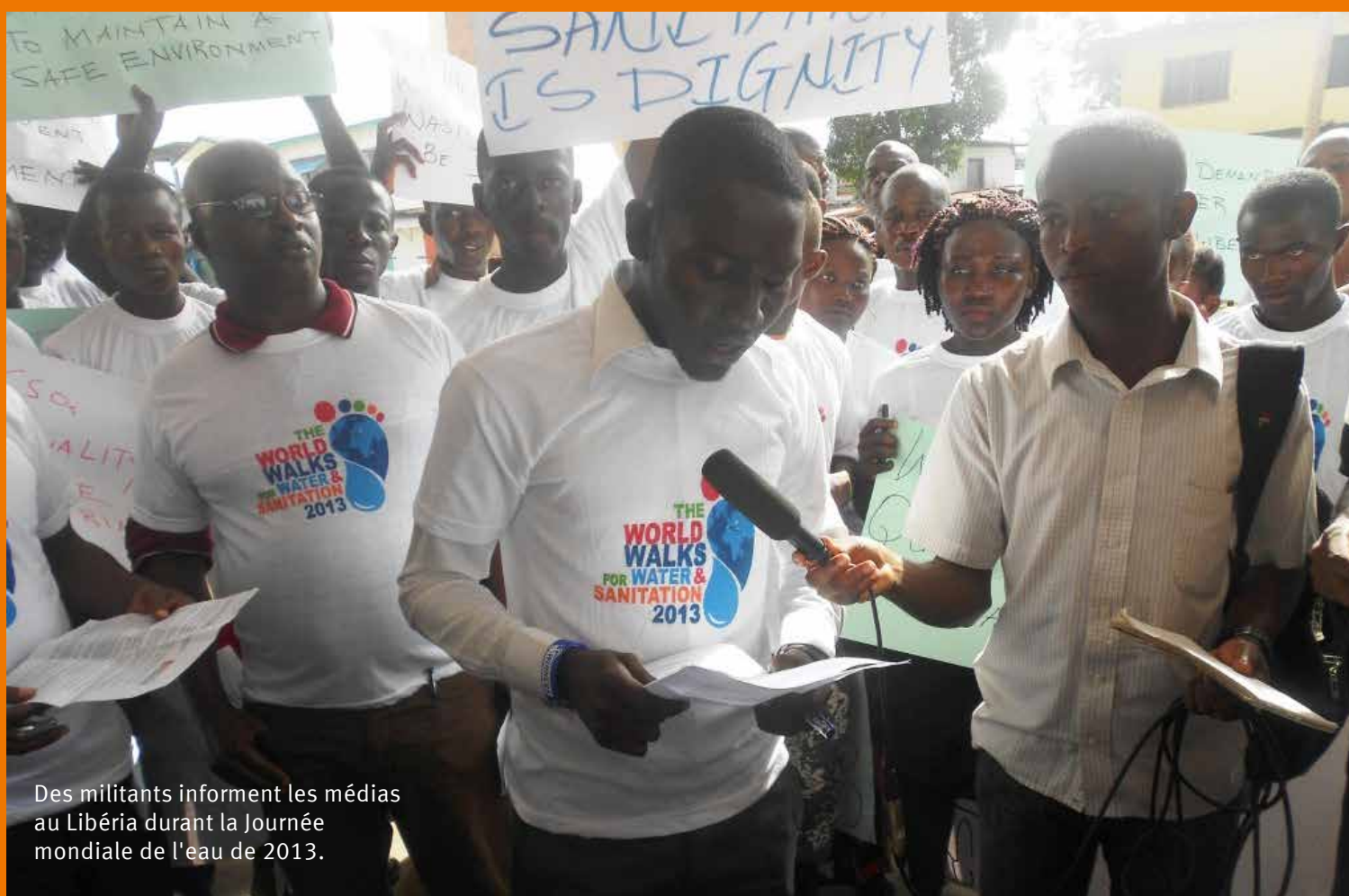
Des militants informent les médias au Libéria durant la Journée mondiale de l'eau de 2013.