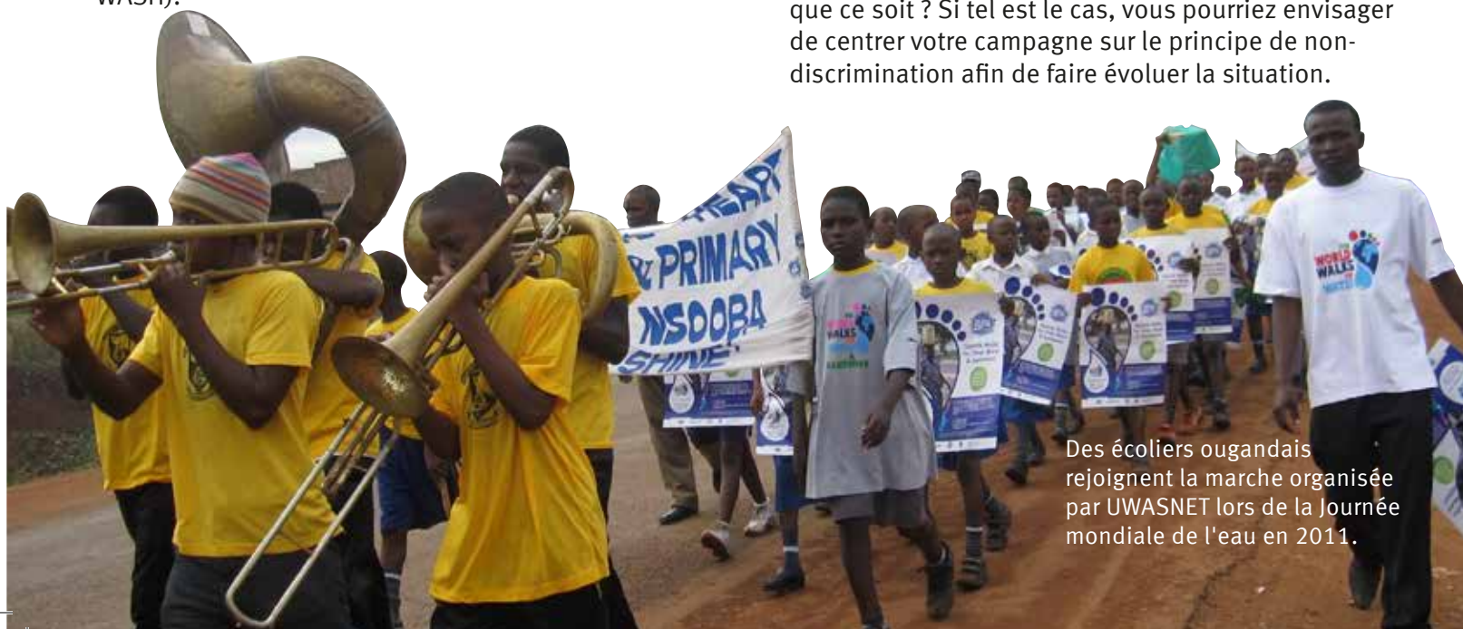
Des écoliers ougandais rejoignent la marche organisée par UWASNET lors de la Journée mondiale de l'eau en 2011.