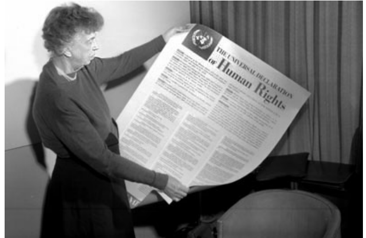
Eleanor Roosevelt, première dame des États-Unis, tenant en main une copie de la Déclaration universelle des droits de l'homme.

L'un des traités clés portant sur les droits humains à l'eau et à l'assainissement est le Pacte international relatif aux droits économiques, sociaux et culturels (ICESCR). L' Art.11 (1) reconnaît le droit à « un niveau de vie suffisant ». L'assainissement et l'eau en sont des composantes.